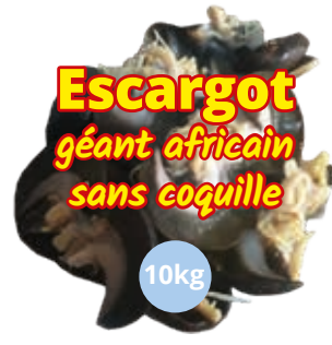
Escargot sans coquille 10kg CAF0018 · 1x