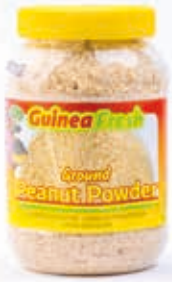
Poudre d'arachide 400g DRD6031 · 12x