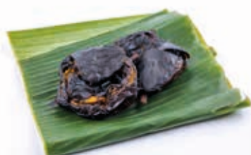
Poisson-chat séché 5kg FIS3018 · 1x