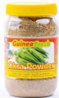
Poudre d'okra Gombo 160g HAS4014 · 24x