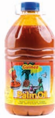
Huile de palme 5L OIL1006 · 4x