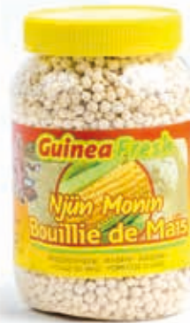
Bouillie de maïs 650g DRD6015 · 12x