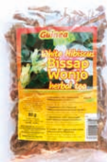
Hibiscus blanc Bissap Wonjo 80g DRD6055 · 40x