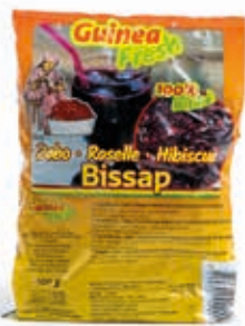
Bissap Hibiscus 100g DRD6008 · 40x