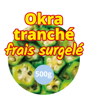
Okra Gombo tranché 500g CAF0019 · 24x