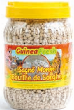
Bouillie de sorgho 1.5kg DRD6020 · 6x