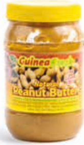
Pâte d'arachide 500g DRD6032 · 24x