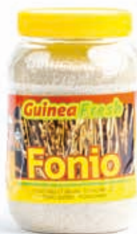
Fonio 850g DRD6003 · 12x