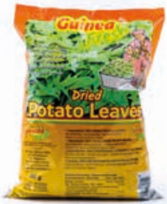
Feuilles de patate 80g DRD6009 · 24x