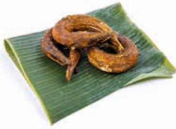
Barracuda 5kg FIS3017 · 1x