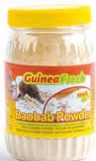
Poudre de baobab 200g DRD6011 · 24x