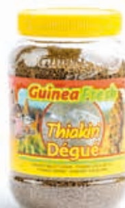
Thiakry Dégué 700g DRD6006 · 12x