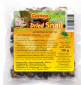
Escargot séché 100g DRD6058 · 100x