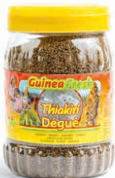
Thiakry Dégué 1.5kg DRD6007 · 6x