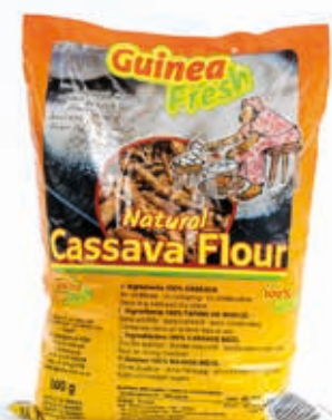
Farine de manioc 800g DRD6012 · 20x