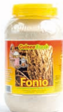
Fonio 2.5kg DRD6004 · 4x