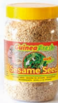
Graine de sésame 350g HAS4011 · 24x