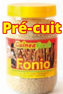
Fonio pré-cuit 500g DRD6053 · 24x