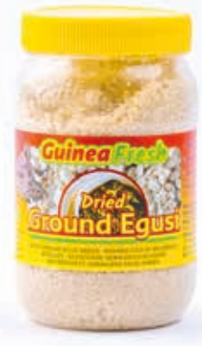
Egusi moulu 400g DRD6030 · 12x