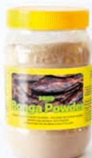
Bonga en poudre séchée 215g FIS3006 · 24x