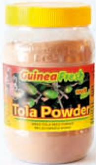
Poudre Tola 340g DRD6056 · 24x