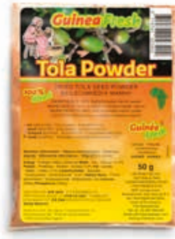
Poudre Tola 50g DRD6017 · 100x