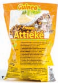
Attiéké 500g CAF0001 · 20x