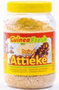
Attiéké séché 800g DRD6039 · 12x