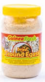
Egusi moulu 250g DRD6029 · 24x