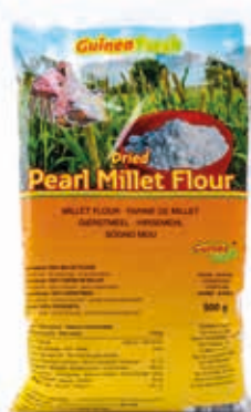
Farine de millet perlé 500g DRD6051 · 40x