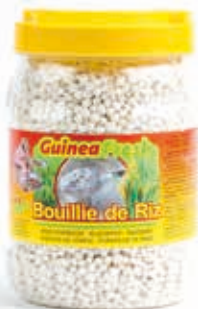
Bouillie de riz 350g DRD6021 · 24x