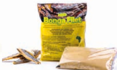
Bonga filet séché 100g FIS3003 · 100x