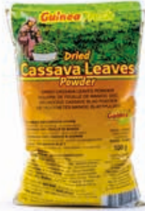
Poudre de feuilles de manioc 80g DRD6013 · 100x