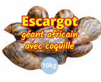
Escargot avec coquille 10kg CAF0017 · 1x