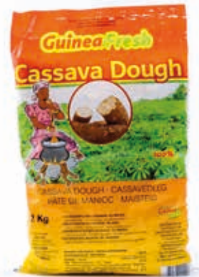
Pâte de manioc 2kg CAF0012 · 12x