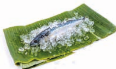
Maquereau atlantique 5kg FIS3007 · 1x