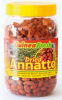
Annatto 250g DRD6054 · 24x