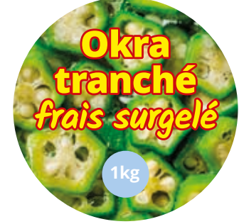
Okra Gombo tranché 1kg CAF0020 · 12x