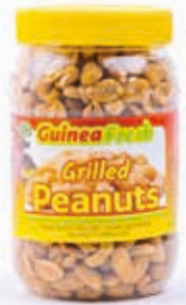
Arachides grillées 350g DRD6035 · 24x

Raffiné et sans sucre · Pâte d'arachide naturelle · Beurre de cacahuète · Beurre d'arachide naturel · Poudre de cacahuète · Cacahuètes grillées · Peanut Butter · Peanut Powder · Grilled Peanuts