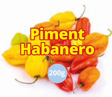
Piment Habanero 200g CAF0021 · 30x