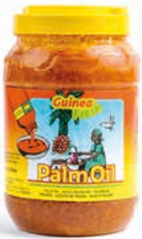
Huile de palme 3L jar OIL1009 · 4x