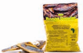
Bonga en poudre séchée 50g FIS3005 · 100x