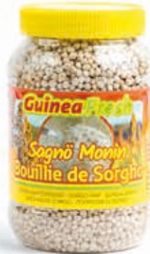
Bouillie de sorgho 650g DRD6019 · 12x