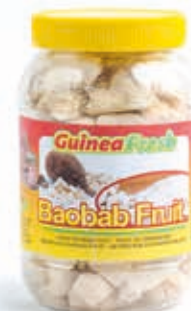
Fruit de baobab 300g DRD6010 · 12x