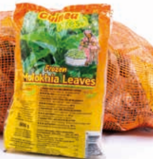
Mloukhiya 500g CAF0009 · 24x