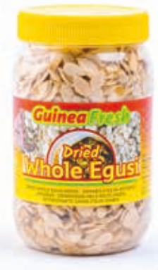
Egusi entier 400g DRD6027 · 12x