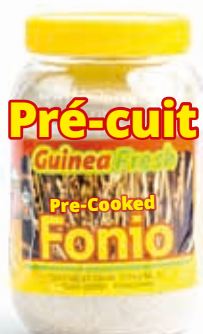
Fonio pré-cuit 780g DRD6059 · 12x