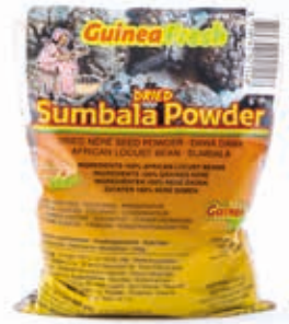
Sumbala Dawadawa en poudre 80g HAS4003 · 100x