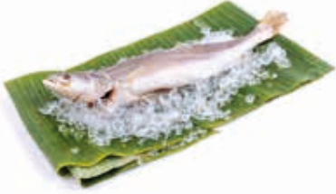
Manioc poisson 5kg FIS3016 · 1x