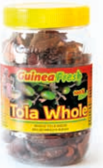
Tola entière 340g DRD6057 · 24x