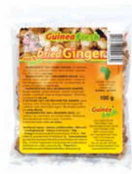
Gingembre séché 100g HAS4012 · 100x