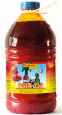
Huile de palme 3L OIL1004 · 4x