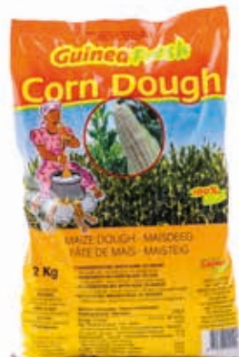
Pâte de maïs 2kg CAF0014 · 12x