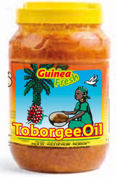
Huile Toborgee 3L OIL1007 · 4x