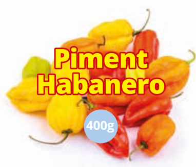
Piment Habanero 400g CAF0022 · 24x