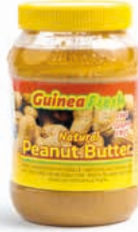
Pâte d'arachide 1kg DRD6033 · 12x