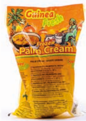
Crème de palme 1kg CAF0023 · 10x