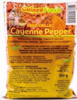
Piment séché en poudre 100g HAS4002 · 50x