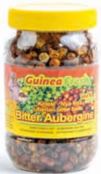
Ketele Aubergine séchée 160g HAS4009 · 24x