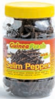
Poivre Selim 200g HAS4008 · 24x