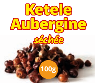
Ketele Aubergine séchée 100g HAS4007 · 24x