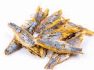
Bonga filet séché 6kg FIS3004 · 1x