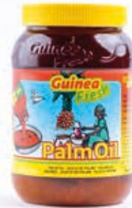
Huile de palme 1L pot OIL1002 · 12x