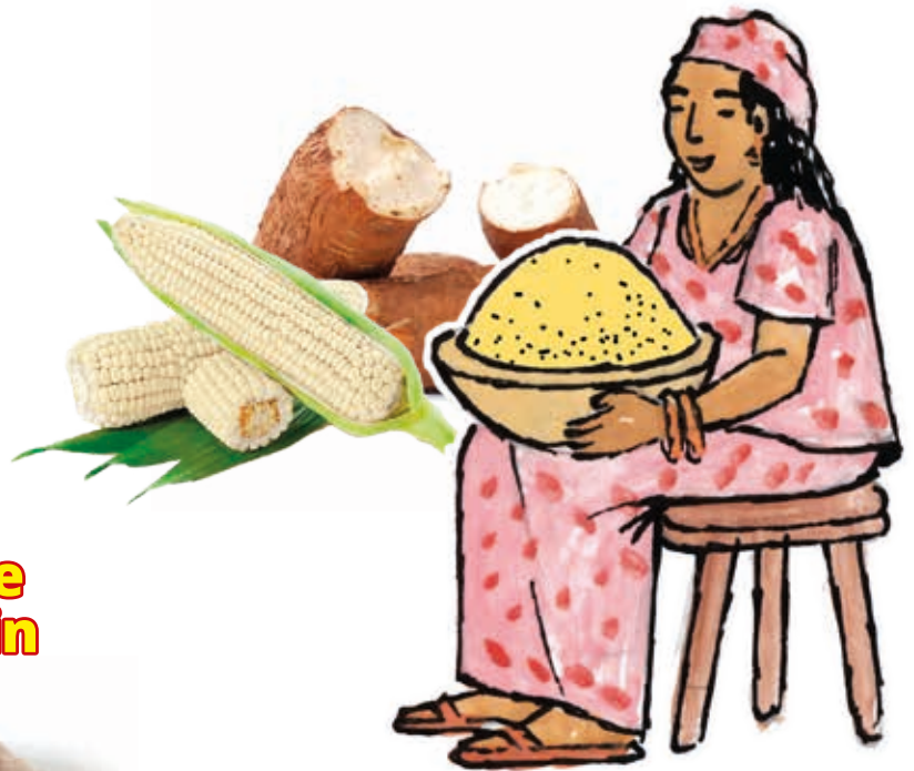
Mélange de Banku 1kg DRD6040 · 20x