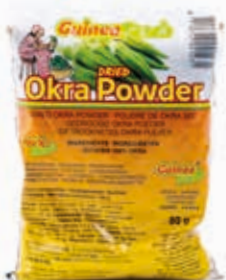
Poudre d'okra Gombo 80g HAS4013 · 100x