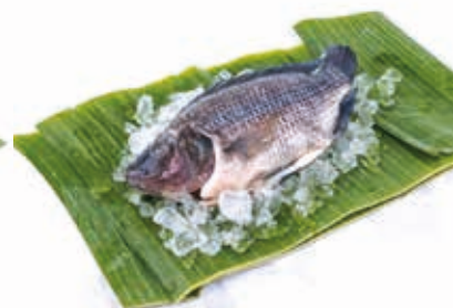
Tilapia noir 5kg FIS3010 · 1x