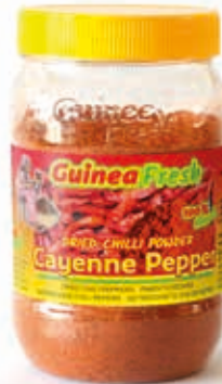
Piment séché en poudre 240g HAS4010 · 24x