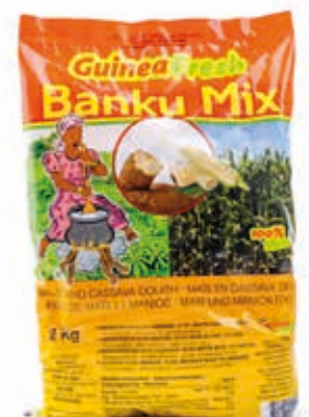
Mélange de Banku 2kg CAF0016 · 12x