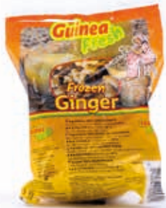
Gingembre 500g CAF0005 · 30x