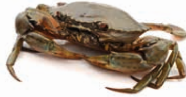
Crabe de boue géant 5kg FIS3019 · 1x