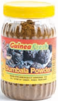
Sumbala Dawadawa en poudre 270g HAS4004 · 24x