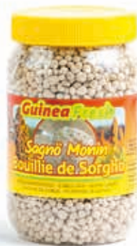
Bouillie de sorgho 350g DRD6018 · 24x