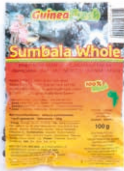
Sumbala Dawadawa entier 100g HAS4005 · 100x