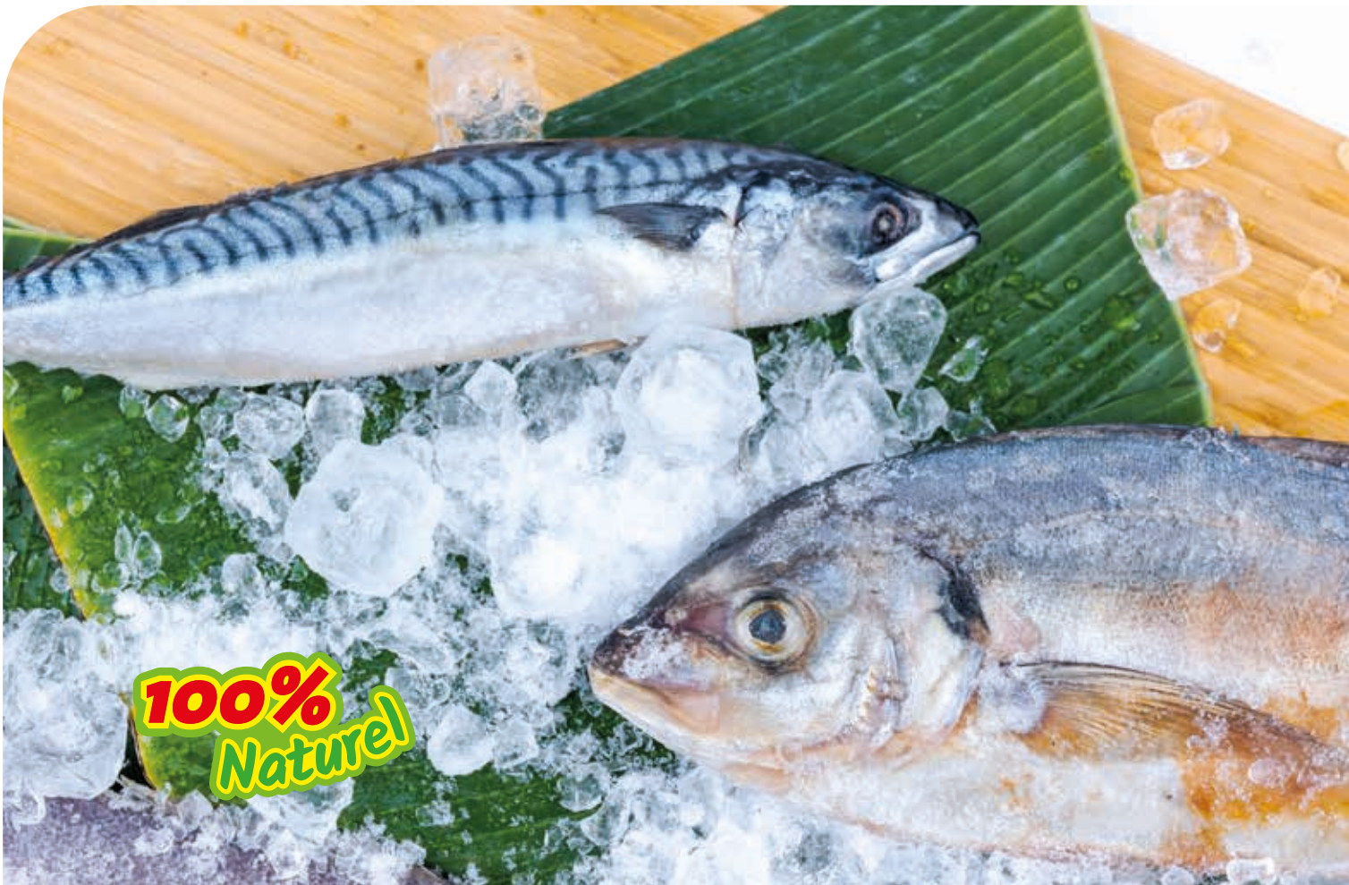
Escargot de mer séché 240g FIS3020 · 24x