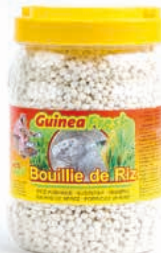
Bouillie de riz 1.5kg DRD6023 · 6x