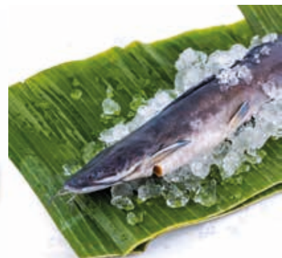
Poisson-chat frais surgelé 5kg FIS3012 · 1x