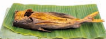
Poisson-chat à tête dure séché 5kg FIS3013 · 1x