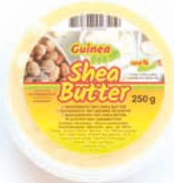
Beurre de karité 250g OIL1010 · 30x