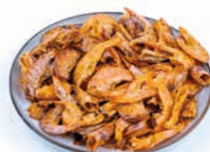
Crevette 5kg FIS3015 · 1x