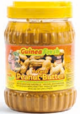
Pâte d'arachide 2kg DRD6034 · 6x