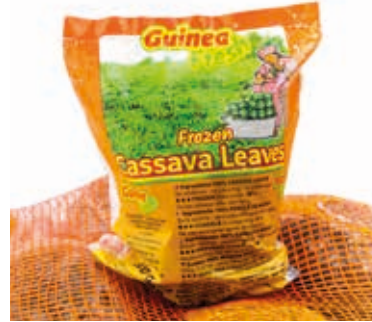
Feuilles de manioc 500g CAF0003 · 30x