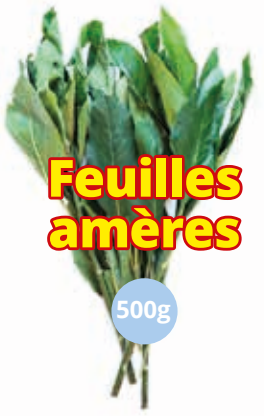
Feuilles amères 500g CAF0024 · 24x