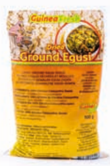
Egusi moulu 100g DRD6028 · 100x