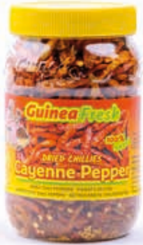
Piment séché entier 100g HAS4001 · 24x