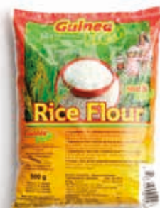
Poudre de riz 500g DRD6024 · 30x