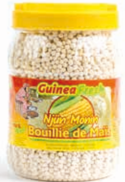
Bouillie de maïs 1.5kg DRD6016 · 6x