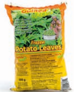
Feuilles de patate 500g CAF0008 · 24x