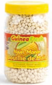
Bouillie de maïs 350g DRD6014 · 24x