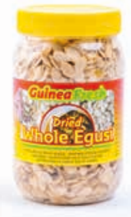
Egusi entier 250g DRD6026 · 24x