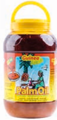
Huile de palme 4.5L OIL1005 · 4x