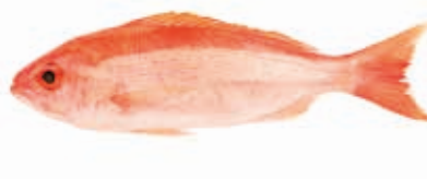
Vivaneau rouge 5kg FIS3014 · 1x