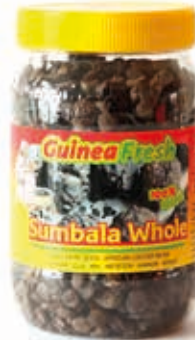
Sumbala Dawadawa entier 270g HAS4006 · 24x