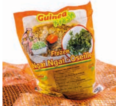
Ngai Ngai Oseille 500g CAF0010 · 30x