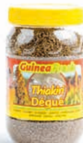
Thiakry Dégué 350g DRD6005 · 24x