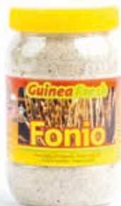
Fonio 400g jar DRD6002 · 24x