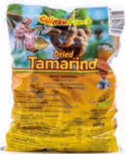
Tamarind 200g DRD6052 · 40x