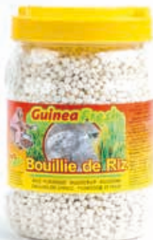
Bouillie de riz 650g DRD6022 · 12x