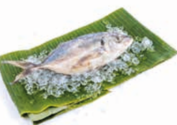
Maquereau bleu 5kg FIS3009 · 1x