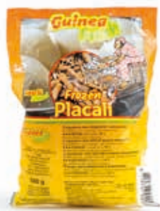
Placari 500g CAF0006 · 30x