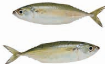
Maquereau à corps court 5kg FIS3008 · 1x