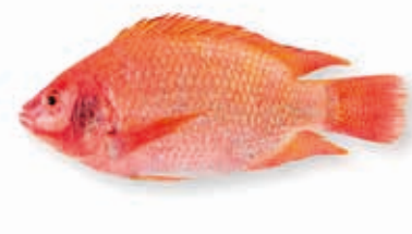
Tilapia rouge 5kg FIS3011 · 1x