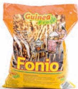
Fonio 400g DRD6001 · 40x