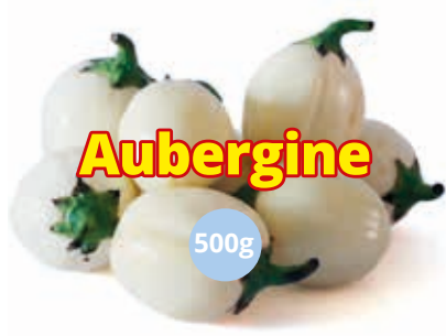
Aubergine 500g CAF0025 · 24x