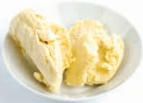
Beurre de karité 10kg OIL1008 · 1x