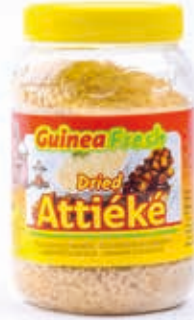
Attiéké séché 400g DRD6038 · 24x